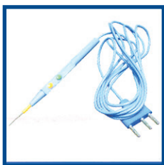
Monopolar Pencil Lápiz Monopolar