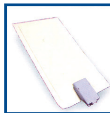
Grounding Pad Placa de Paciente